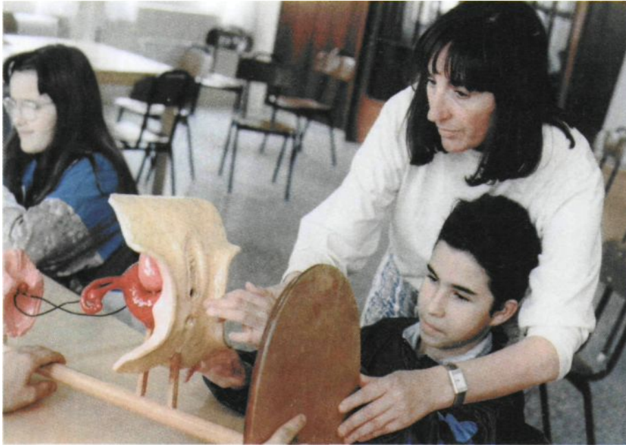
Figura 9. La autora explicando el aparato reproductor femenino (parte externa) a un alumno ciego, en un curso de formación sexual para adolescentes

Hablamos del amor y sobre las actitudes corporales para enamorar, el aspecto físico, rostros expresivos, el control de movimientos estereotipados (que muchos de ellos poseen).