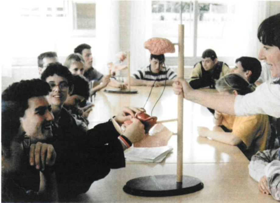
Figura 7. Alumnos en un curso de Educación Sexual

3) Entender la relación sexual como una forma de comunicación afectiva que busca el placer propio y el de la otra persona (temas Transversales. MEC).