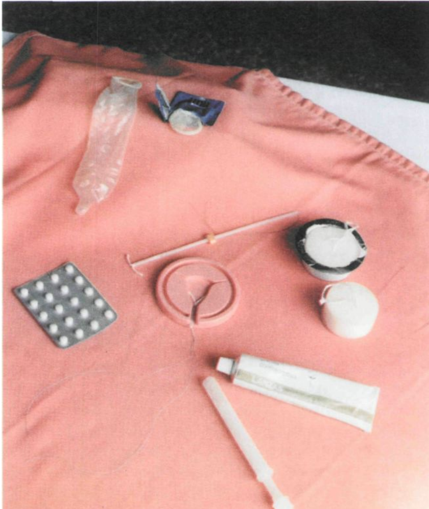
Figura 10. Algunos anticonceptivos de los que se explican en los cursos de formación sexual

Explicamos cómo se produce un embarazo, cuánto dura, cómo es un parto natural, cómo provocado (Tema 3º). Al mismo tiempo explicamos la responsabilidad de ser padres y madres, utilizando ejemplos del significado de la maternidad / paternidad. La reproducción asistida y la adopción también son temas que se ven en el curso.