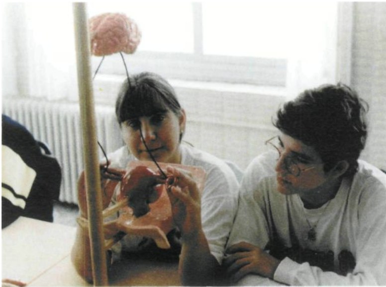
Figura 4. Dos alumnos "viendo" la maqueta del aparato reproductor femenino

primero hace referencia a cambios fisiológicos y el segundo a los aspectos psicológicos y sociales que conlleva esos cambios físicos.